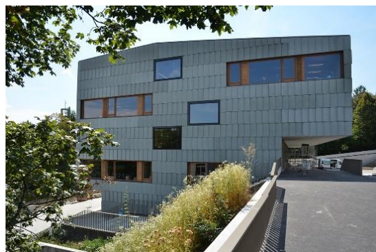
DOSF – Deutschsprachige Orientierungsschule in Freiburg